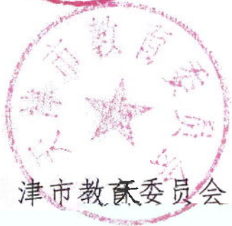
天津市教育委员会