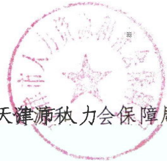
天津市人力资源和社会保障局